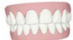
3D Modell von Deinen Zähnen nachher