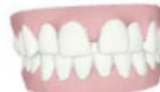
3D Modell von Deinen Zähnen vorher

Beginne sofort - frage deinen Zahnarzt, ob Invisalign Teen für dich geeignet ist!